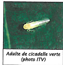
Adulte de cicadelle verte

La technique a été homologuée en France en 1995 et n'est utilisée actuellement que sur moins de 2% du vignoble. Les essais que nous avons menés sur une décennie dans le sud-ouest depuis 1989 sur l' Eudémis n'ont pas démontré l'apparition de problème particulier.