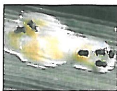
Trichogrammes parasitant des œufs de pyrale

Ce sont des micro-Hyménoptères d'une taille inférieure au millimètre principalement représentés par les Trichogrammes.