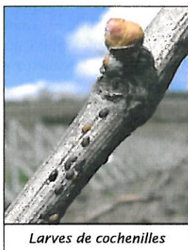
Larves de cochenilles

En Champagne, la part des surfaces sous confusion est la plus élevée. La mutualisation de la lutte sur de grandes surfaces