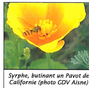
Syrphe, butinant un Pavot de Californie

ple). Leur fréquence au vignoble n'est pas liée obligatoirement à la prédation des tordeuses. Les études en laboratoire démontrent souvent que ces prédateurs ont une action aussi bien à leur stade larvaire qu'adulte. Mais les résultats ne semblent pas toujours transposables au terrain.