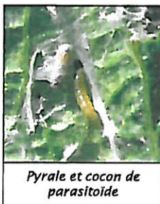
Pyrale et cocon de parasitoïde

On trouve des mouches Tachinaires, inféodées aux vignobles du sud, tel Phytomyza nigripes , avec des taux de parasitisme naturel de 25 % sur les larves de première génération d'Eudémis. Une autre espèce, Pseudoperichaeta nigrolineata , a été observée en Bourgogne sur Pyrale.