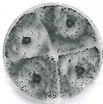
Développement de colonies de Trichoderma à partir de rondelles de bois. Le potentiel antagoniste de ce champignon varie selon les espèces et les souches. In vitro, ce potentiel est souvent plus important qu' in vivo.

En 2004, des résultats prometteurs ont été obtenus avec des souches de Trichoderma particulièrement performantes en conditions de laboratoire (Larignon et Molot, 2004). Le caractère « biologique » de ce nouveau traitement potentiel, ne pouvait pas mieux tomber quelques années avant le Grenelle de l'environnement. Les possibilités de protection des plaies de taille par des microorganismes antagonistes avaient déjà été suggérées par d'autres auteurs (Chapuis, 1998). Mais cet espoir de lutte biologique a hélas été vite déçu par les premiers essais en vignoble (Sentenac et al., 2005). Cet écart entre les résultats de laboratoire et ceux du champ n'est pas nouveau en matière de lutte biologique. Un tel écart est également observable en matière de stimulation des défenses. Il peut s'expliquer par les différences de milieu d'études. Sur gélose, les champignons à croissance rapide, tels les Trichoderma , peuvent rapidement prendre le dessus sur les champignons à croissance plus lente, voire totalement masquer leur développement. Ce comportement peut conduire à surestimer leur potentiel. Appliqués sur les tissus d'une plaie de taille, qui ne constituent pas leur milieu naturel - même si on peut en isoler occasionnellement - l'effet inhibiteur ou antagoniste des